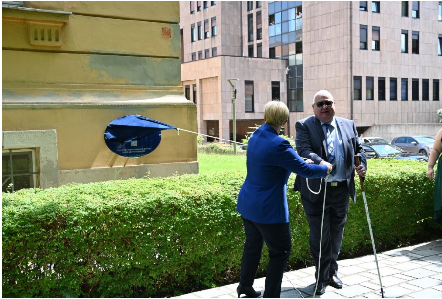
Slika: Svečano odkritje postavitve spominske plošča

Ob tej priložnosti je primeren trenutek tudi za osvetlitev dogodkov, povezanih z ustanavljanjem, premestitvami in ugašanjem edine še delujoče izobraževalne ustanove za slepe in slabovidne od njenega začetka do danes. Spoznali bomo, da je to obrobna in premalo obravnavana tema v vzgojno izobraževalnih in socialnih politikah naše družbe in da se način delovanja izobraževalnih ustanov za slepe in slabovidne v zadnjih 100 letih ni bistveno spremenil. Odgovorni bodo verjetno to zanikali in predstavili dosežke, vendar je namen tega prispevka osvetliti tudi drugo plat, ki se pogosto zamolči.