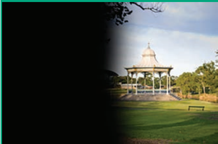
ZOŽENO VIDNO POLJE

Med slepe torej v nasprotju s splošnim prepričanjem ne uvrščamo le tistih oseb, ki so popolnoma izgubili sposobnost vida in je njihovo zaznavanje svetlobe enako nič (amaurosis), ampak mednje štejemo tudi tiste, ki imajo določen ostanek vida (do 5 %), vendar je ta tako pičel in necelovit, da človeku v neznanem okolju ne omogoča samostojne orientacije.