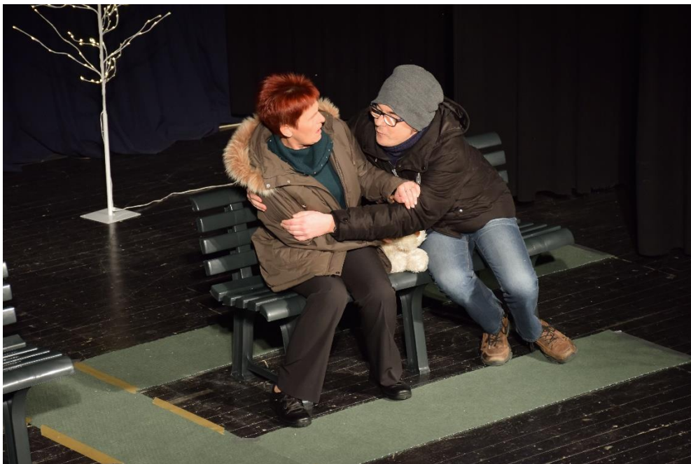
Igralci na gledališkem odru; preproga na odru predstavlja orientacijo slepim igralcem

Odgovor: »To pa je vprašanje, na katerega bi zagotovo lažje odgovorili člani zasedbe. Nekatere stvari imajo, kakor so mi povedali, že utečene, za druge se je treba potruditi in dogovarjati. Pri teh rečeh se znajdeš pred kopico organizacijskih težav, na katere pa moraš pravzaprav misliti že med ustvarjanjem. Npr. kar najbolj enostavna scena, ki ne potrebuje posebnih prevozov, kostumi, ki se lahko skoraj kjerkoli in kar najhitreje preoblečejo, lučni efekti, ki jih premore praktično vsak oder in še in še.... Moja želja je pripeljati to predstavo ali pa katero od naslednjih v javnost, na televizijo. Želela bi, da čim več ljudi spozna in vidi, česa so sposobni tisti, ki se ne vdajo in predajo. To si zaslužijo predvsem oni, pa tudi vsi mi ostali, da se zavemo, da pot vedno obstaja, na nas pa je, ali se po njej podamo.«